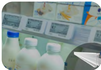
レールとアタッチメント