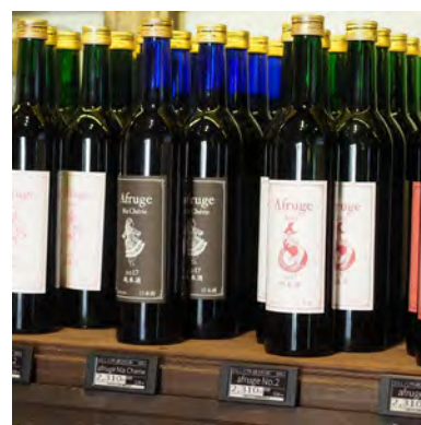
いにしえ酒店・北品川様