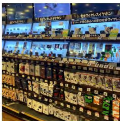
大手家電量販店様